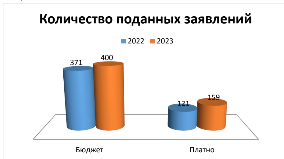
Рис. 1. Количество поданных заявлений

В период приемной кампании 2023 года общее количество заявлений от абитуриентов по программам специалитета, бакалавриата, магистратуры, аспирантуры и ассистентуры-стажировки на обучение за счет бюджетных ассигнований составило 400 заявлений, на места с полным возмещением затрат – 159 заявлений.